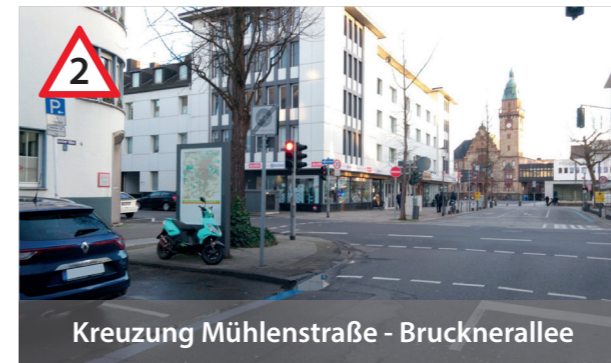
Kreuzung Mühlenstraße - Brucknerallee

Eltern dürfen nicht halten, absolutes Halteverbot! Rückstau, unübersichtliche Verkehrssituationen