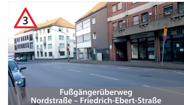
Fußgängerüberweg Nordstraße - Friedrich-Ebert-Straße

Kreuzungsbereich unübersichtlich, Fußgänger leicht zu übersehen, spät sichtbar hinter Autos